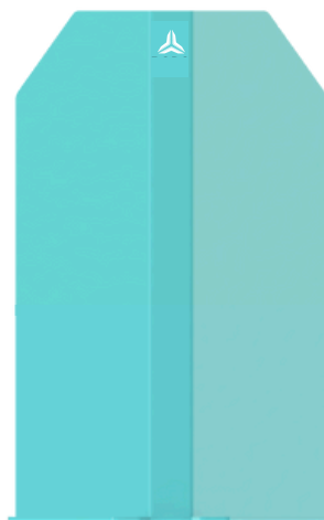
PROJETO SEGURO À MEDIDA