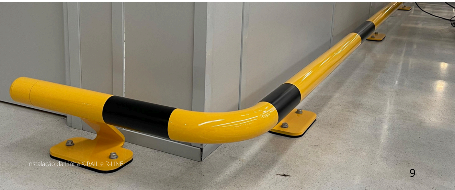
Instalação da Linha X-RAIL e R-LINE.